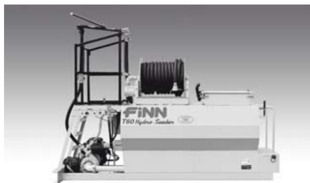
T60 Series II HydroSeeder Straight Pull Trailer. (T60T)

Firma FINN, jako lider innowacji, już od ponad 70 lat zapewnia najwyższej jakości sprzęt dla zielonej branży. A wszystko po to by zapewnić Tobie pełną satysfakcję z uzyskany efektów.