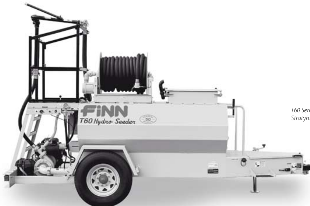
T60 Series II HydroSeeder Straight Pull Trailer. (T60T)

FINN T60 Seria II to doskonały 2 270 litrowy hydrosiewnik dla małych firm z zielonej branży, które wymagają szybkiej i ekonomicznej obsługi. Technologia produkcji hydrosiewników firmy FINN została opracowana w 1953 roku i od tamtej pory FINN jest liderem, zarówno pod względem jakości produkowanych hydrosiewników jak i wprowadzania innowacyjnych rozwiązań.